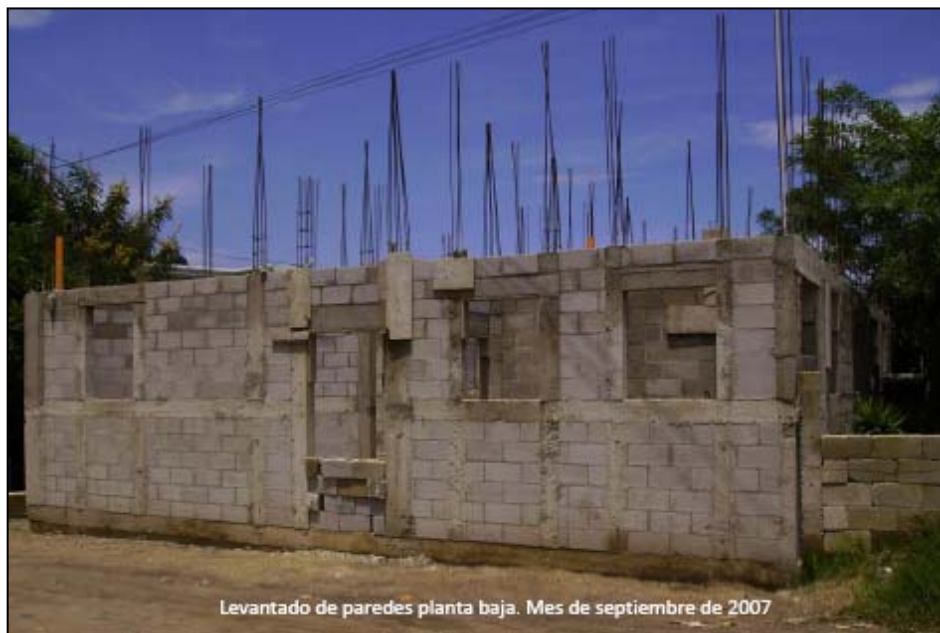
Levantado de paredes planta baja. Mes de septiembre de 2007