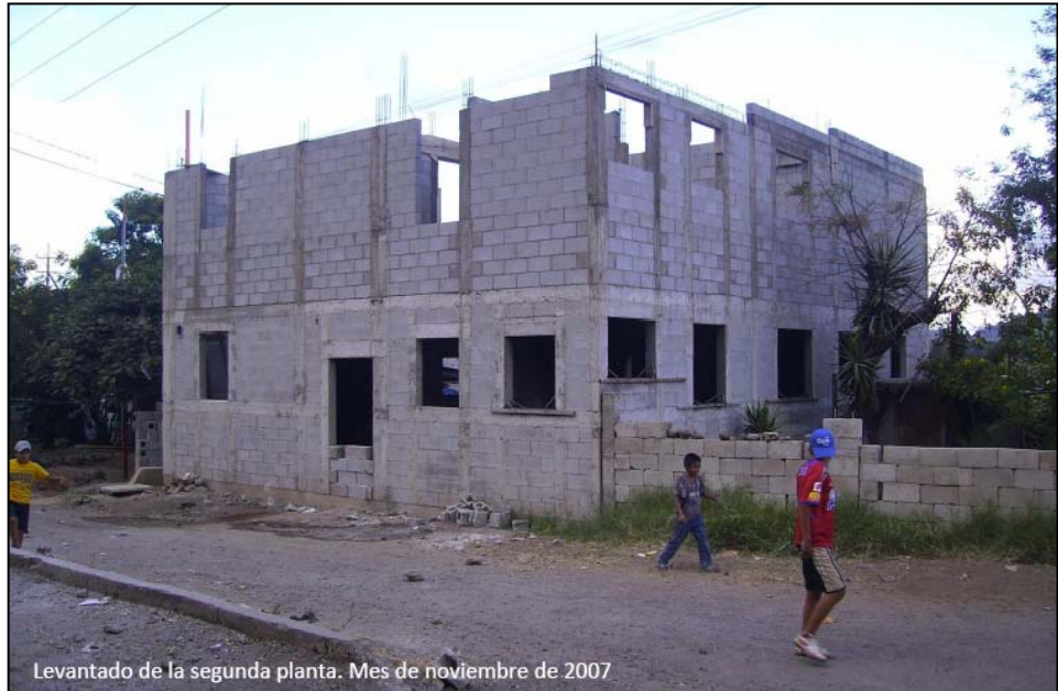
Levantado de la segunda planta. Mes de noviembre de 2007