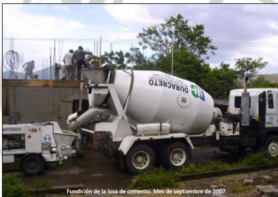
Fundición de la losa de cemento. Mes de septiembre de 2007